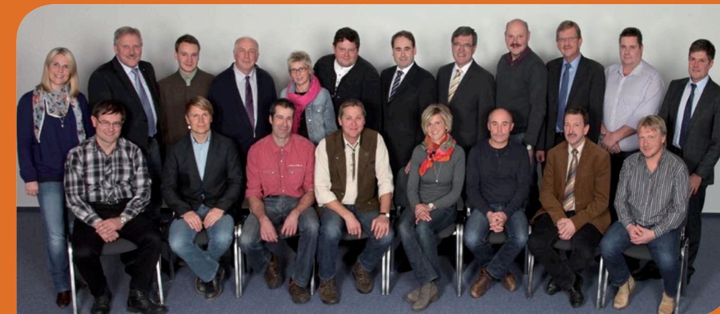
Postwurfsendung an alle Haushalte

Liebe Mitbürgerinnen, liebe Mitbürger, wir bitten um Ihre Stimme für